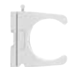
Kunj gypash me hark të hapur RC