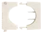
Unazë kabllosh SCH, ngjyra: Najlon transparent