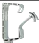
Mbajtës kabllosh SHA