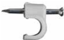
Kapëse kabli, me thumb NS