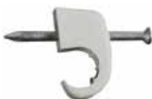
Kapëse kabli, me thumb me shtrirje të gjërë MNS