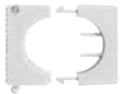
Unazë kabllosh SCH, ngjyrë hiri RAL 7035