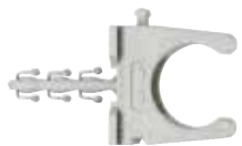
Kunj gypash me hark të hapur RC Steckfix plus SF plus RC