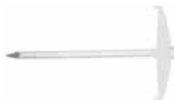
Kapëse katrore kabli, me gozhdë NSB