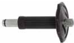
Mjet futjeje për gozhdë betoni me goditje SZE