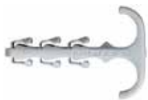
Kapëse e dyfishtë kabllosh „Steckfix plus“ SF plus ZS