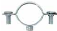
Unazë metali me vidha AM